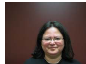
Par Louise Rock, directrice